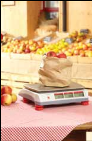
Gyümölcs és zöldség- piacok

Az Aviator 5000 stílusos, hordozható kiskereskedelmi mérleg alkalmas arra, hogy számos kiskereskedelmi környezetben használják, mint például a nyitott piacokon, a mozgó értékesítésekben vagy kisebb szaküzletekben. A robusztus, mégis könnyű konstrukció, beleértve a kiváló minőségű rozsdamentes acéllemezből készült teherfellevőt tökéletesen illeszkedik bármely környezetbe, ahol az élelmiszerhigié- nia, a hordozhatóság és a precizitás alapvető követelmény. A magas minőségű mérési technológia teszi a Aviator-t megbízható és tartós befektetéssé. A mérleg használata gyors és egyszerű köszönhetően az ergonomikus billentyűzetnek és az egyszerű felhasználói felületnek, melyek - felgyorsítják az ügyfél kiszol- gálását.