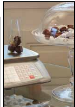
Édesség, csokoládé és tea