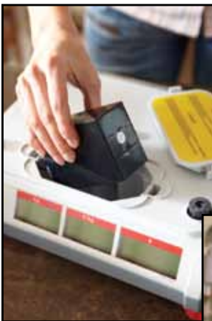
Mozgó értékesítés - elemről történő tápellátással