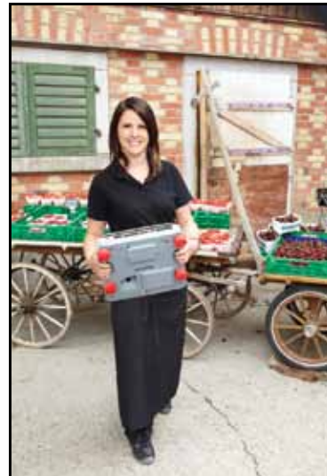
Egyszerű hor- dozhatóság a beépített fogantyú segítségével