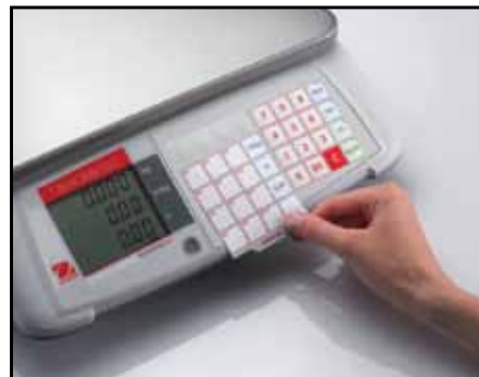
Cserélhető áru- lista kártya