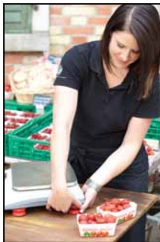
Állítható magasságú lábak